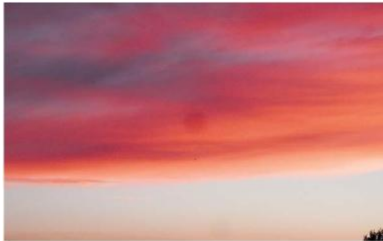
Nube artificial sobre Zamora

enorme que, a través de sensores mejorados en tierra, mar, aire y en el espacio, y mediante un sistema computarizado avanzado, ofrecería predicciones meteorológicas en tiempo real, reales o virtuales. Esa red, está claro, aportará acceso a los centros de predicción alrededor del mundo, ofreciendo predicciones a la carta. En otras palabras nos encontramos ante la creación de un