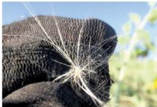
Últimas fibras aparecidas en los campos de los agricultores zamoranos

Aquí, por vez primera, se habla de unas instalaciones en Gakona, Alaska, en las que se está llevando a cabo un Programa de investigación de alta frecuencia auroral activa conocido por sus siglas en in-